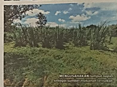
MENGUSAHAKAN rumput napier sebagai sumber makanan ternakan.

kambing dengan hanya memberi fokus kepada biri-biri kerana sifatnya yang berkumpulan lebih mudah dijaga dan dikawal serta mengurangkan kos ternakan.