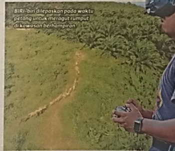
BIRI-biri dilepaskan pada waktu petang untuk meragut rumput di kawasan berhampiran.

kami perlu memeriksa keadaan biri-biri dan makanan sekali lagi diberikan sekiranya ia masih lapar. Apabila hujan, jumlah makanan meningkat sekali ganda berikutan ternakan tidak boleh dilepaskan seperti biasa," katanya.